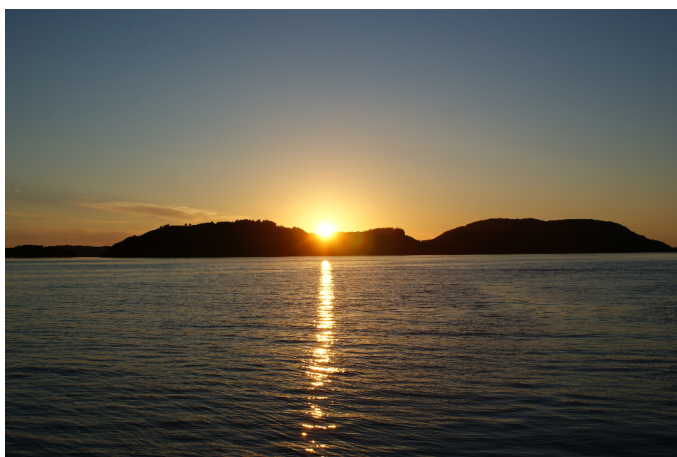
Blir det slikt vær gjennom Solund under Seilmakeren Doublehanded i 2023?

Det følgende er for det meste hentet fra «Den Norske Los» bind 3. Alle bindene av dette nyttige bokverket er fritt tilgjengelig på Internett. Egen erfaring har vist at disse generelle beskrivelsene av strømbildet aldri må tas for en absolutt sannhet. Som beskrevet ovenfor, vil de lokale værforholdene spille en viktig rolle. De som er lokalkjente på ruten vil også ha lagt merke til at noen steder skiller seg fra det generelle bildet, så lokal kunnskap og egen erfaring kommer alltid godt med.